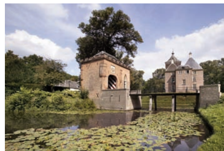
(2) Landgoed Soelen